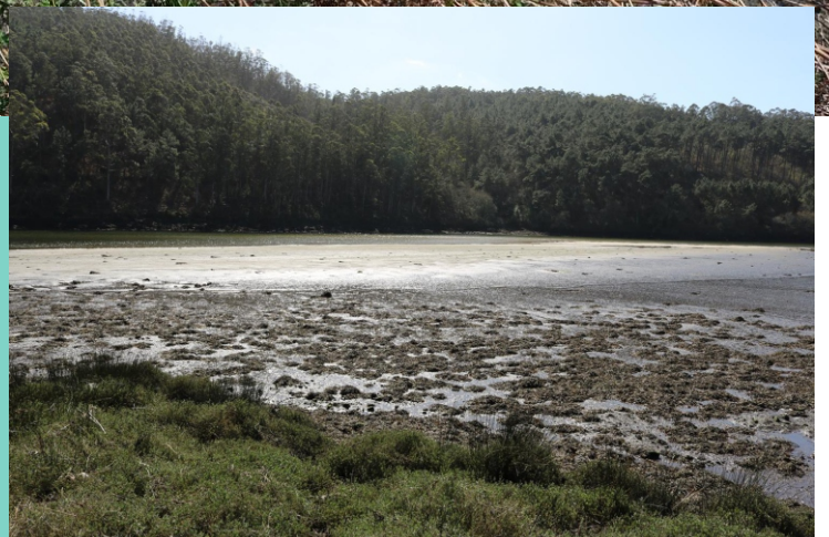
9-Furna do Sapo