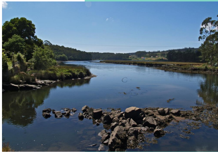
4-Esteiro do Río Grande ou do Porto