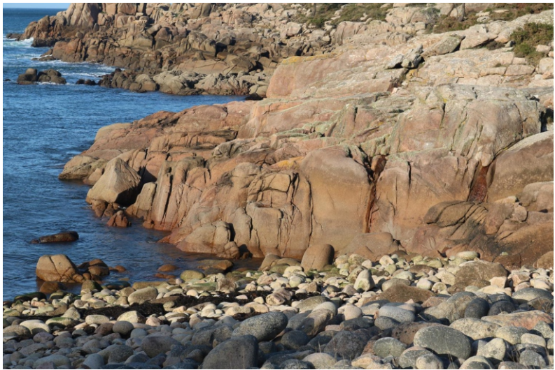
2-Rego e Coído da Señora