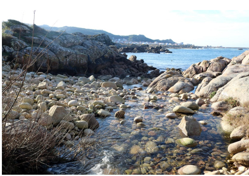
1-Rego da Albariza

O tramo da ría de Camariñas é de 2,5 km, en Cereixo , un espazo de fondo de ría e esteiro, unha zona de mestura de augas doce e salgada e terreo areoso lamacento sen grande interese paisaxístico, en parte urbanizado e en parte privatizado, que non se pode percorrer coa marea alta porque as propiedades chegan á beira da auga, e coa marea baixa só é un lameiro polo que non paga a pena meterse. O espazo remata na Furna do Sapo , a onde se pode chegar seguindo o Camiño dos Faros que volve á beira do mar preto dese punto.