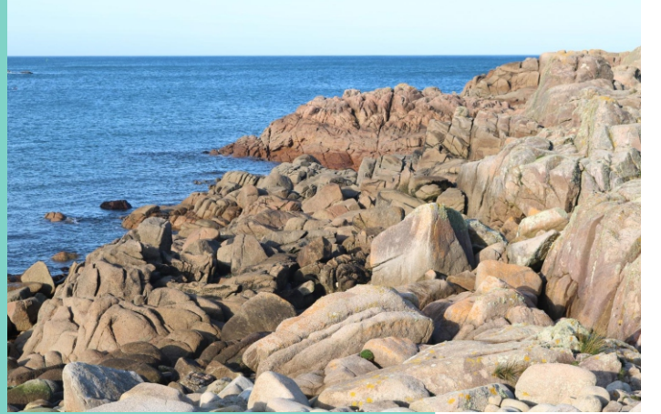
Enseada de Sabadelle