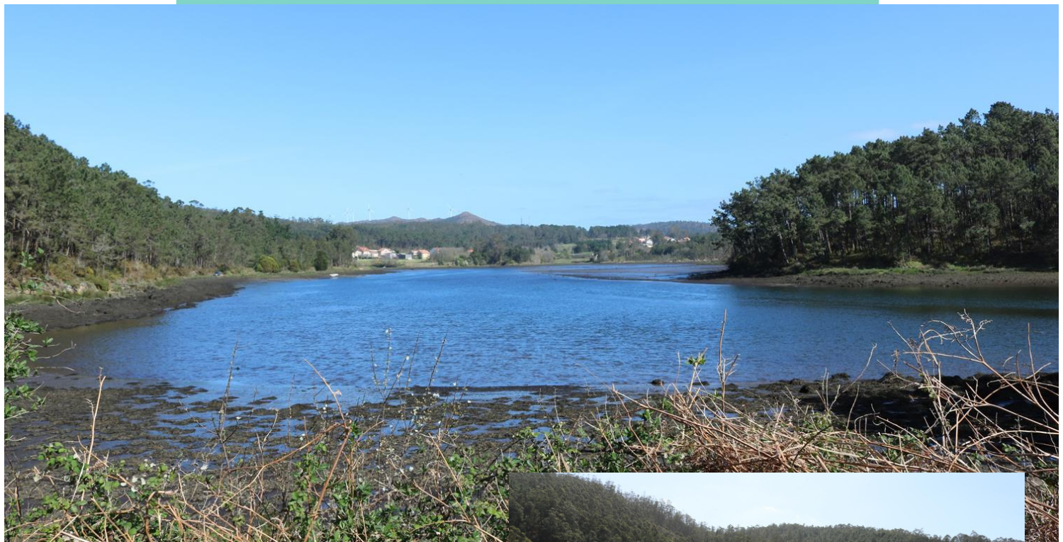
Esteiro do río Grande ou do Porto