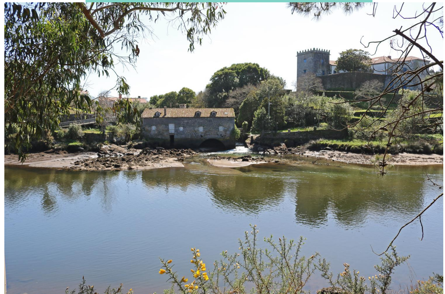
Vista do esteiro coas Torres do Cereixo e o muíño de Marea