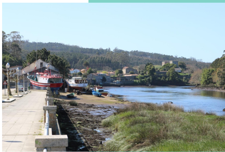
6-O Cereixo. Porto