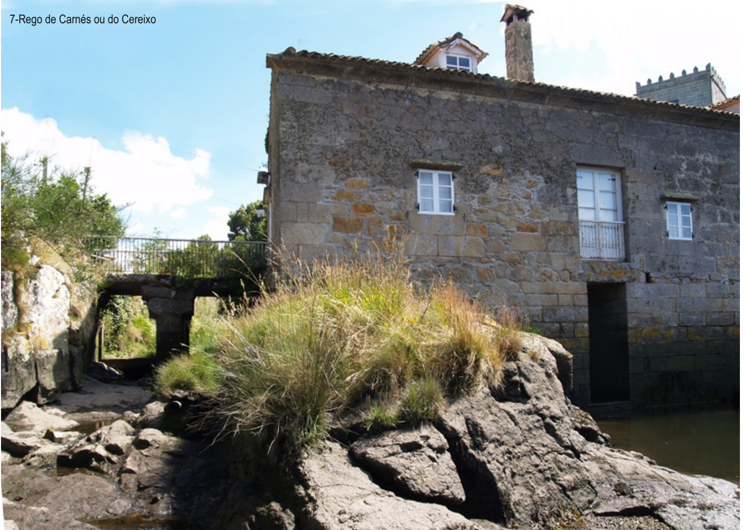
7-Rego de Carnés ou do Cereixo

Muíño de mareas da Torre ou das Arceas, na desembocadura do río do Cereixo. O edificio orixinal (do século XVII) sufriu moitos cambios, antigamente só tiña un andar, hoxe hai dous e foi adaptado para vivenda.