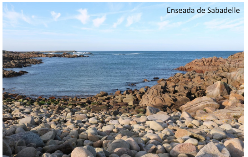
Enseada de Sabadelle