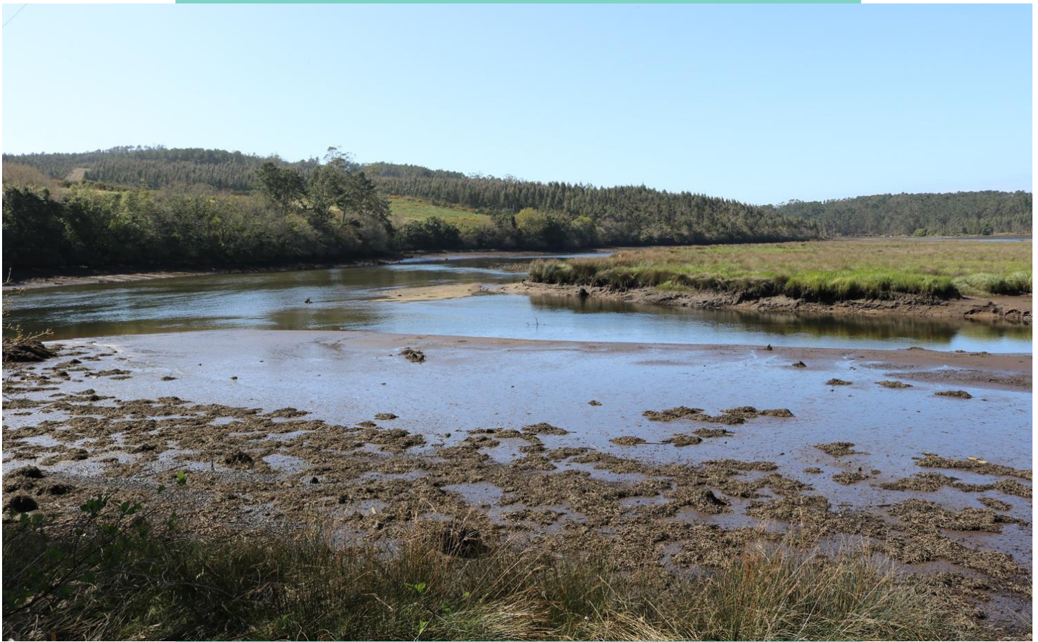
8-Illa Forno do Sapo